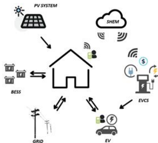
Fig. 1: Sistema SHEM proposto

A partir da integração das estações de recargas ao SHEM, junto a entrada de preferência do usuário do EV: horário de partida do EV da residência e locais e horários que ele poderá deixar o VE em um EVCS, o sistema de gerenciamento insere em sua rotina de otimização as possibilidades de recargas em EVCS com objetivo de determinar o melhor regime de operação para o VE, observando ainda os recursos DER da residência.