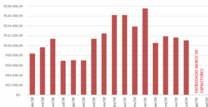
Fig. 6 Pagamento de multas por excesso de reativos

Ajuste na contratação de energia junto a RGE: Foi ajustado o contrato de fornecimento junto a RGE, concessionária local, conforme legislação vigente. A partir de agosto/2019 não existem mais valores na conta por ultrapassagem da demanda contratada.