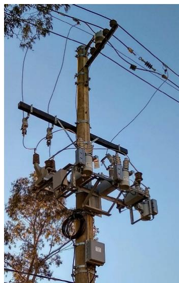
Fig. 5 Banco de Capacitores instalado na UFSM

- Instalação de bancos de capacitores: Com o objetivo de ajustar o fator de potência das instalações da Universidade e estancar o pagamento de multas por excesso de reativos foram instalados dois bancos de capacitores totalizando 600kVAR, um em cada troncal dos alimentadores da UFSM. Um investimento de R$ 40.000,00. A partir de agosto/2019 o fator de potência foi ajustado e não teve mais a incidência de multas por este motivo. A figura 5 mostra o equipamento instalado na Av. Roraima e a figura 6 demonstra a evolução dos pagamentos com multas por excesso de reativos.