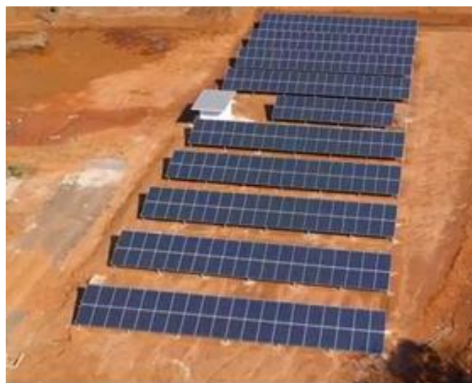
Fig. 2 Planta de Minigeração Fotovoltaica

● Instalação de um sistema de minigeração de energia elétrica utilizando cerca de 380 módulos fotovoltaicos, com capacidade instalada de aproximadamente 100 kWp. Figura 2 demonstra a planta instalada ao lado do Prédio 09E (Intituto de Redes Inteligentes).