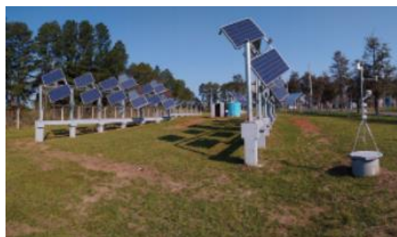
Fig. 3 Planta experimental reconfiguração geotérmica

● Inclusão e monitoramento de resultados através de Sistema de arrefecimento geotérmico e reconfigurações fotovoltaica solar, conforme demonstrado na figura 3.