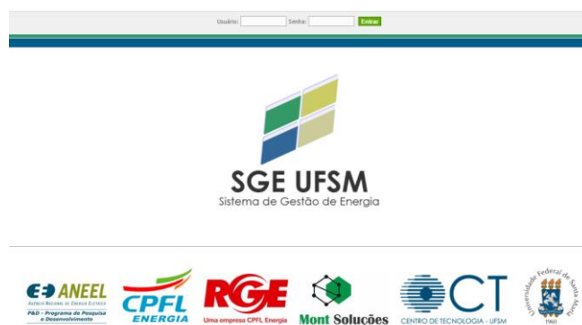
Fig. 1 Tela do software de Gestão de Energia

Para acompanhar e apoiar a implementação, monitorar resultados e centralizar a documentação, está em fase final de desenvolvimento um software para suportar todas as funções do SGE de forma que a gestão do sistema seja efetuada com eficácia garantindo o pleno controle de todos os documentos do sistema. Considerando que o software está sendo desenvolvido concomitantemente à implementação do sistema é importante que a plataforma tenha funções que possam facilmente ser parametrizadas para contemplar necessidades futuras visando garantir plena aderência a todas as necessidades do projeto. Para garantir que o software suporte plenamente os requisitos do projeto a especificação foi elaborada considerando esta particularidade. A Figura 1 demonstra a tela de login do sistema.